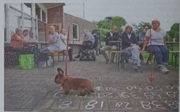
Een konijn in actie.

Na ongeveer twintig minuten lijkt de Wener haar favoriete plek te hebben gevonden. Ze snuffelt aan het hek „Hup konijn”, roept een eending. Het beestje heeft geen naam, alleen een nummer. Zonder dat het publiek het doorheeft, laat het knaagdier een heel klein keuteitje achter. Precies op de rand van tegel